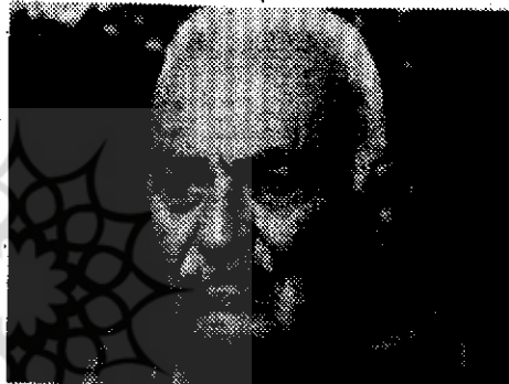
○ دکتر منوچهر ستوده