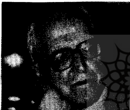
○ دکتر عباس زریاب خویی