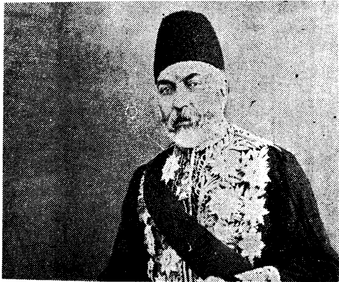
○ امین الدوله، پدر دکتر علی امینی

نشان دادن وفاداری خود به مردی که او را بالا کشیده بود.