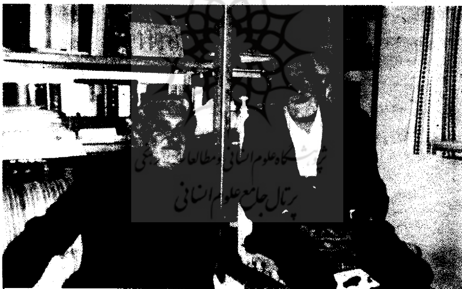
با دکتر داریوش شایگان

که یکی از هدف‌های مردم‌شناسی مطالعه سیر تحولی فرهنگ جامعه است. برای شناخت سیر تحولی و پی بردن به قدم‌های اولیه فرهنگ چند راه بیشتر موجود نیست؛ یکی مطالعه زندگی و فرهنگ جوامع ابتدایی و ساده است، که تا اندازه‌ای دست‌نخورده باقی مانده. راه دیگر باستان‌شناسی است که با دسترسی به ابزار و وسایل هزاره‌های گذشته ما را با فرهنگ پیشینیان