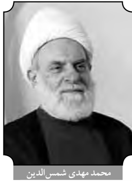
محمد مهدی شمس‌الدین

نمایش‌نامه‌ها و ... که هر یک، وجهی از این تأثیر ماندگار و متداوم را نمایان ساخته‌اند. همه این‌ها نشانه‌های ارج و گستردهٔ نفوذ ماجرای برخورد سیدالشهداء و یارانش با یزید و لشکریانش را نشان می‌دهد، اما هنوز بسیاری از عالمان و دانشوران دینی و مورخان و مصلحان را راضی نمی‌کند و ایشان در پی فلسفه‌ای ژرف و خوانش متفاوت و نو از آن جریان بزرگ هستند. این خوانش تازه، از آن رو ضرورت یافت که گرد خرافه و لکه روایات کذب و پیرایه تفاسیر ناصواب و نتیجه‌گیری‌های ناهنجار در این عرصه ملاحظه شد. اتفاقاً بسیار هم رواج یافت تا جایی که در دوره جدید نهضتی برای پالایش و نقد آن پدید آمد. علمای بزرگ و نواندیش و روشنفکران مؤمن و اصلاح‌گرا به میدان آمدند تا راه‌گشایی کنند و جبهه‌ای در برابر تحریفات عاشورا و خرافه‌های و پیرایه‌های پدیدآمده پیرامون آن بگشایند. برخی آثار، نظیر کتاب شریف لؤلؤ و مرجان اثر محدث نوری و تحریفات عاشورا تألیف استاد مرتضی مطهری در میان نوشته‌های عالمان متقدم و متأخر معاصر سرآمد این گرایش سنجش‌گرانه و پیرایش‌گر خرافات محسوب می‌شود. در کنار ایشان، آثار پرشور دکتر علی شریعتی و نوشته‌های نغز دکتر سید جعفر شهیدی نیز در زمره راه‌گشایان و بهترین آثار در این عرصه، از روشن‌فکران معاصر ماست. این نمونه‌ها و بسیاری از تلاش‌های دیگر، می‌باید در آثار و مقالاتی انتقادی، بیانگر رویکرد عالمانه و