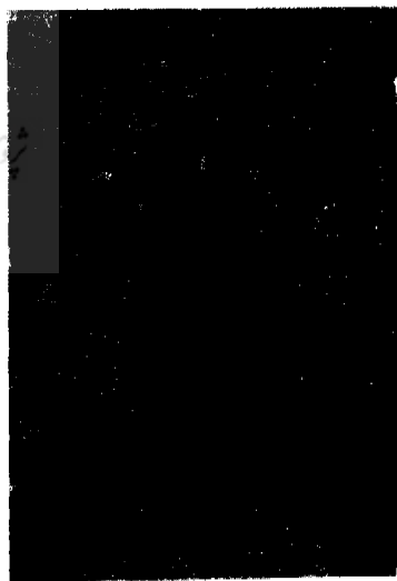
مشاورالملک محمود (پاریس ۱۸۶۰)