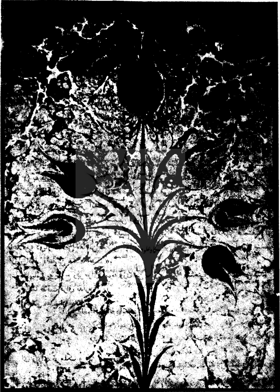
۴- قطعه‌ای کاغذ ابری گلدار ساخت مصطفی دوزگنمن