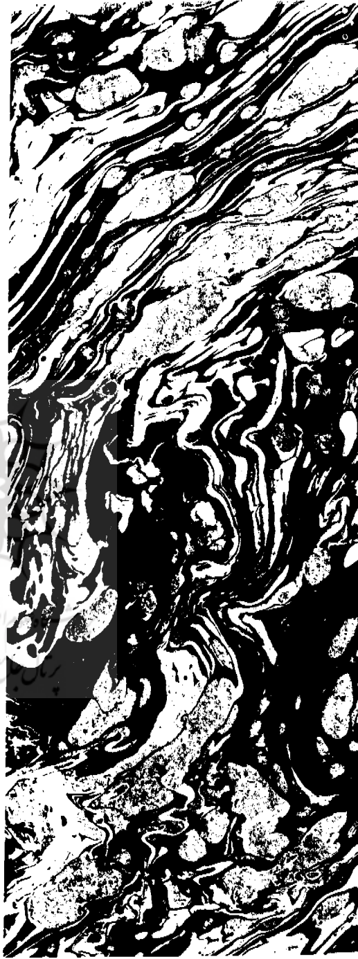
۱ - قطعه‌ای کاغذ ابری از دوره صفوی