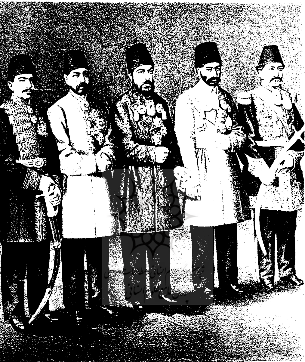
تصویری از سفرنامه یوشیدا