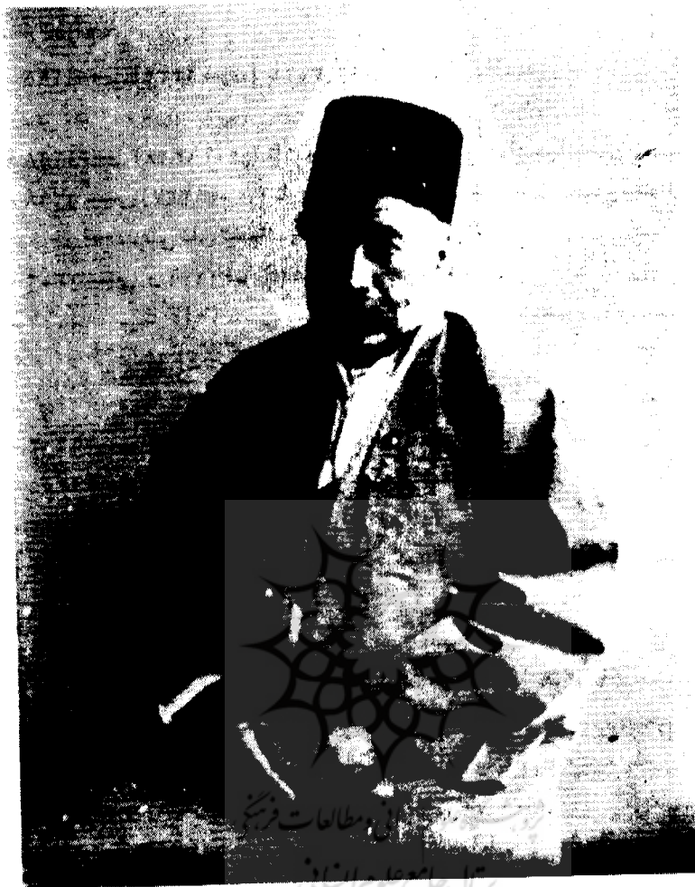
تصویر حاجی نجم الدوله (عبد الغفار)