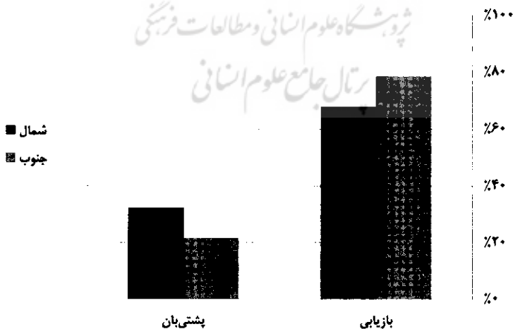
نمودار ۱- درصد کاربرد راه‌بردها به تفکیک مناطق آموزشی شمال و جنوب

در نمودار ۱، تمایز به‌کارگیری راه‌بردها در دو دسته‌ی اصلی بازیابی و پشتی‌بان به تفکیک مناطق آموزشی شمال و جنوب دیده‌می‌شود.