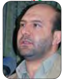
دکتر صارمی شهردار کرمانشاه

می‌کنند و خودشان هزینه می‌کنند شاید یکی از جاهایی است که ما متأسفانه اسراف زیادی مشاهده می‌کنیم. از بخش‌های ستادی بخش‌های اداری، نیروهایی که کمتر مرتبط به مجموعه هستند، هزینه اضافه در پروژه‌های عمرانی و... اینها مسائلی است که می‌توانیم با نظارت بر آنها تا حدود زیادی این دستور مهم رهبر انقلاب را جامه عمل بپوشانیم.