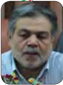
دکتر تابش فر مدیرکل امور شهرداری‌های وزارت کشور

تغییر الگوی مصرف در جامعه صرفا با استفاده از ابزار تبلیغات و فرهنگ ممکن و میسر نمی‌شود، بلکه از ابزارهای دیگر هم باید توأمان استفاده بکنیم. من در این رابطه می‌توانم با چند پیشنهاد مدیریتی، از جمله مدیریت هوشمند در تمام سطوح ساختاری در شهرداری‌ها، چه در حوزه عمرانی و چه در حوزه جاری، به‌جای مدیریت روزمره‌ای که در شهرداری‌ها حاکم است این را بتوانیم جایگزین کنیم.