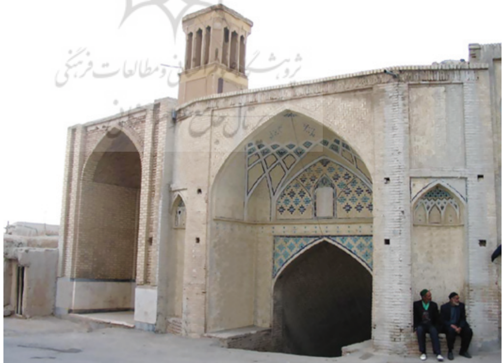
آب انباری در شهر نراق

بله. چرا که طبق نگرش‌هایی که وجود داشت به بافت تاریخی به عنوان تهدید نگاه می‌شد. بنابراین شهرداری نیز به عنوان یکی از تخریب‌کنندگان این بافت‌های ارزشمند شناخته می‌شد. ضمن اینکه در سال‌های قبل و زمانی که