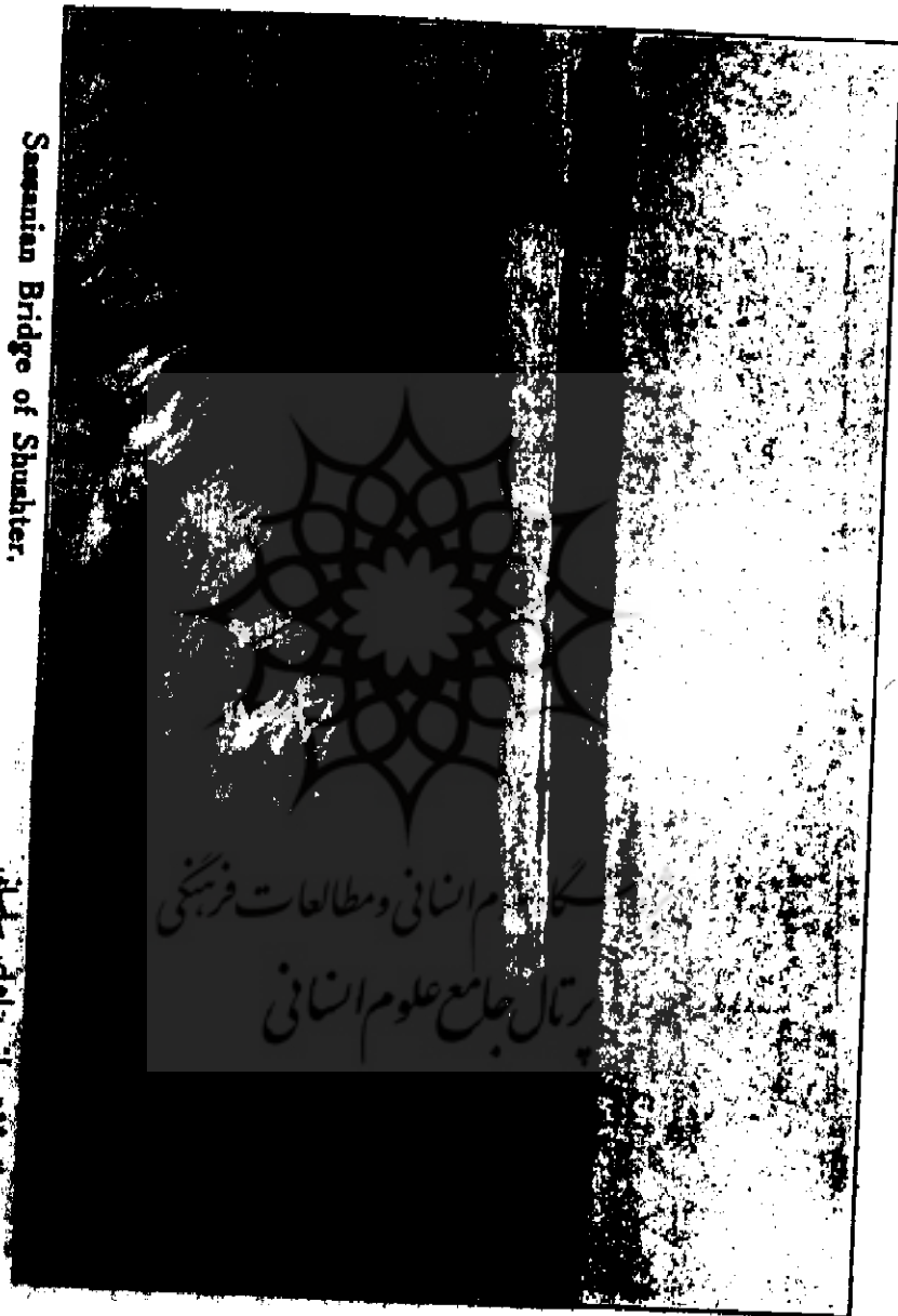
Sassanian Bridge of Shushter.

دیم جقدر آباد بوده و چه فوایدی از این ایالت مهم بر میداشتند. رودخانه کارون که از کوه‌های بختیاری و رود کرخه که از کوه