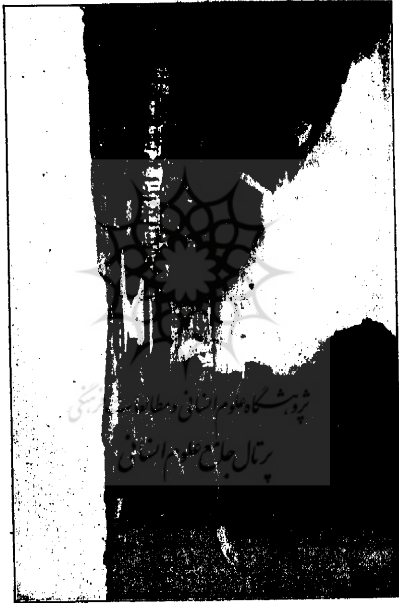
بندهای ششتر از آثار ساسانی

معروف ششتر با اینکه قسمی خراب شده است؛ خرابه‌های شهر چند شاپور در نزدیکی کازرون که نوشیروان در آنجا دارالعلم و بیمارستان