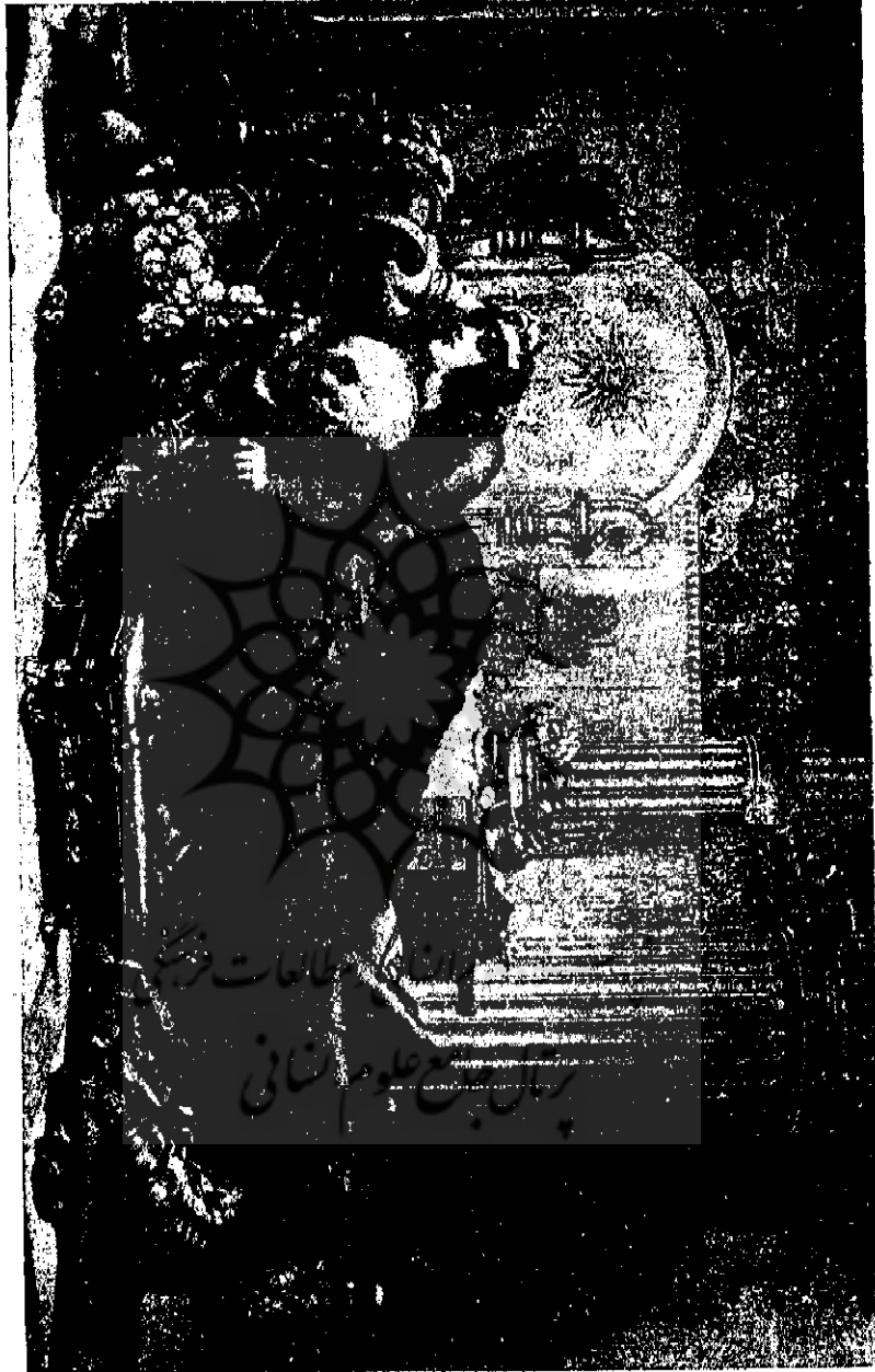
تصویر « واسی » ملکه ایران و زن کرسیس --- نگارش نقاش آتالی ارادت نورمان