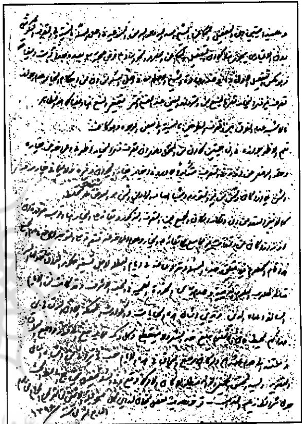
اخلاق، نصیحت، علم اعداد و اوقاف بحث می نماید.

بيست و سومين و آخرين جلد از مجموعه آثار موجود از آيت الله مصطفی خميني، در كتابخانه آيت الله العظمی مرعشی نجفی (قدس سره) «كتاب الصوم» است كه دارای شماره موقت ۱۳۳۹۶ است كه به خواهش جمعی از طلاب و در ايام تعطیلي حوزه علمیه نجف، به نگارش درآمده است. این كتاب در ۲۳۰ صفحه بر روی كاغذهای كاهی (اصطلاحاً فرنگی وسط با قدمت حداكثر ۵۰ سال) نوشته شده است كه هر صفحه دارای ۱۴ سطر است. این نسخه، تاریخ و محل كتابت ندارد.