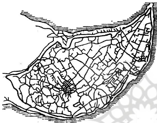
شهر چونگینگ در کشور چین نمونه‌ای از شهرهای دوره قرون وسطی است خطوط درهم و ناموزون، نمودار خیابانها و کوچه‌های شهر می‌باشد.

در زمینه پیدایش و منشأ نخستین شهرها سه پایگاه تفکر: «ایجاد»، «تکامل» و «پخش» باهمدیگر مطرح هستند. بر مبنای این پایگاه‌های فکری، اراضی پست رودخانه‌ای خاور نزدیک محیط خاصی را ایجاد کرده‌اند که مازاد حاصل از کشت محصولات و پرورش حیوانات بنیان‌هایی برای زندگی شهری فراهم آوردند. سپس شیوه زندگی شهری ابتدا به نواحی مجاور و بعد به مکان‌های دورتر گسترش پیدا کرده است. این روند در قالب تکامل از اشکال اولیه زندگی روستایی تا ایجاد شهرهای کوچک نیز بیان می‌شود. در قالب این پایگاه‌های تفکر، چهار نظریه جامعه‌آبی، اقتصادی، نظامی و مذهبی را در رابطه با منشأ شهر مطرح شده است. در این چهار نظریه به ترتیب بر مفهوم مازاد تولید، نقش مکان بازار، موقعیت دفاعی - نظامی سکونتگاه و نقش عبادتگاه و زیارتگاه به عنوان عوامل اصلی در تعیین شکل شهر تأکید می‌شود.