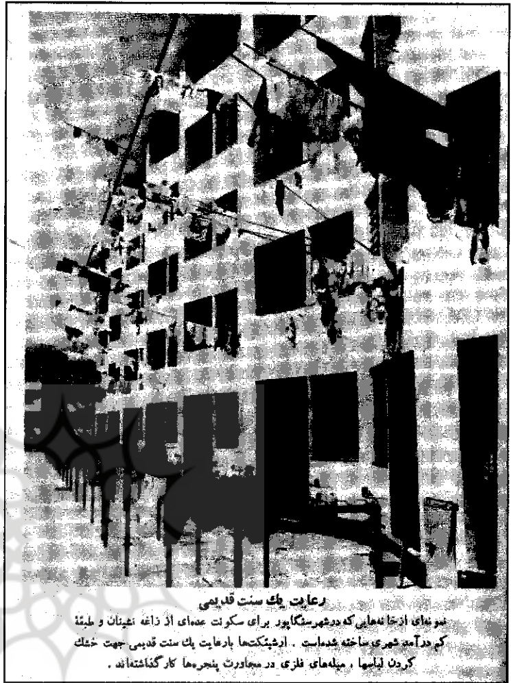
رعایت يك سنت قديمي نونهای ازخانه‌هایی که در شهرتکاپور برای سکونت عده‌ای از ذاعه غنیمان و طینت کم درآمده شهری ساخته شده‌است . ادرشکتها بارعایت يك سنت قديمي جهت خشك کردن لباسها ، منله‌های فززي در مجاورت پنجره‌ها کار گذاشته‌اند .

جغرافیای شهری در حقیقت ترسیم و تشریح شکل تجمع و نوع فعالیت انسان‌ها در مناطق شهری و تحلیل دگرگونی‌های این اشکال در ارتباط با فضای شهری و روابط پیرامونی در زمان و مکان است