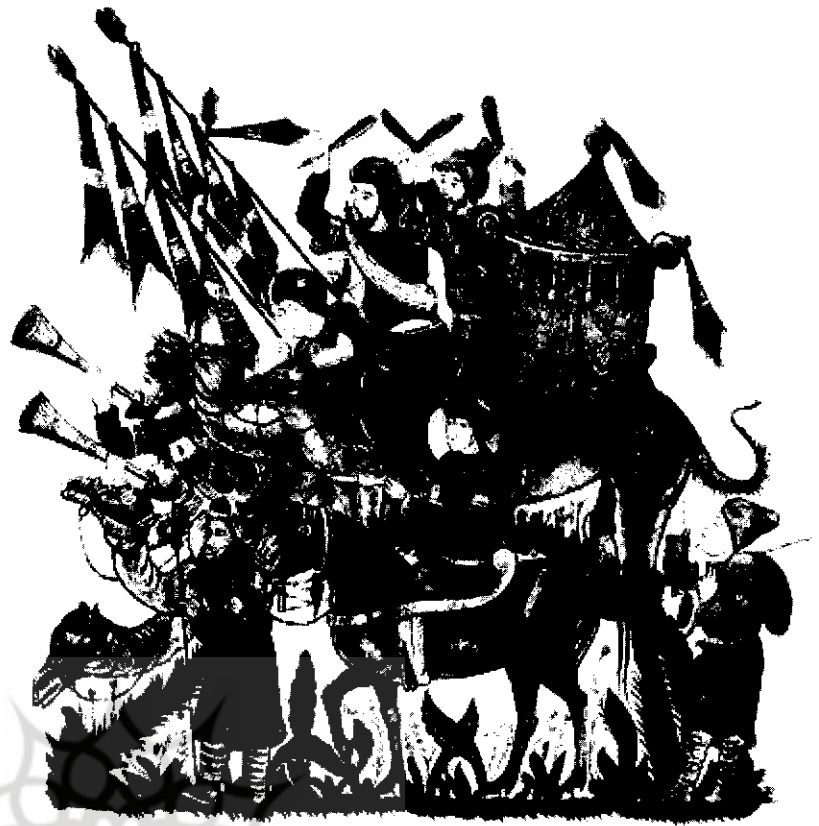
مراسم تشریفات رسمی به سبک مغول در دوره ایلخانان که همراه با نواختن سرنا و دهل و طبل بوده است، از نسخه‌های کتاب مقامات حریری، سده هفتم هجری

● مورخان قرون هشتم و نهم هجری عموماً چهره‌ای مثبت از اوضاع در دوره فرمانروایی ابوسعید و به خصوص نیمه دوم آن ارائه می‌کنند. تحولاتی چون افزایش اقتدار شخص سلطان پس از قتل امیر چوپان، بهبود مناسبات با ممالیک و انس بیشتر مغولان با فرهنگ ایرانی - اسلامی نیز دست کم در ظاهر نشان از بحرانی نبودن اوضاع در این سال‌ها دارد