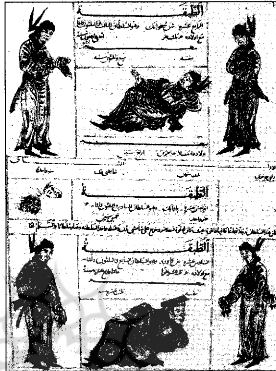
التواریخ است. ۱۵

ارتباط داشته است. همچنین بخش تاریخ چین جامع التواریخ، نخستین اثر مستقل و گسترده‌ای است که در سیر تاریخ نگاری در ایران و اسلام درباره چین تألیف شده است. ۱۷