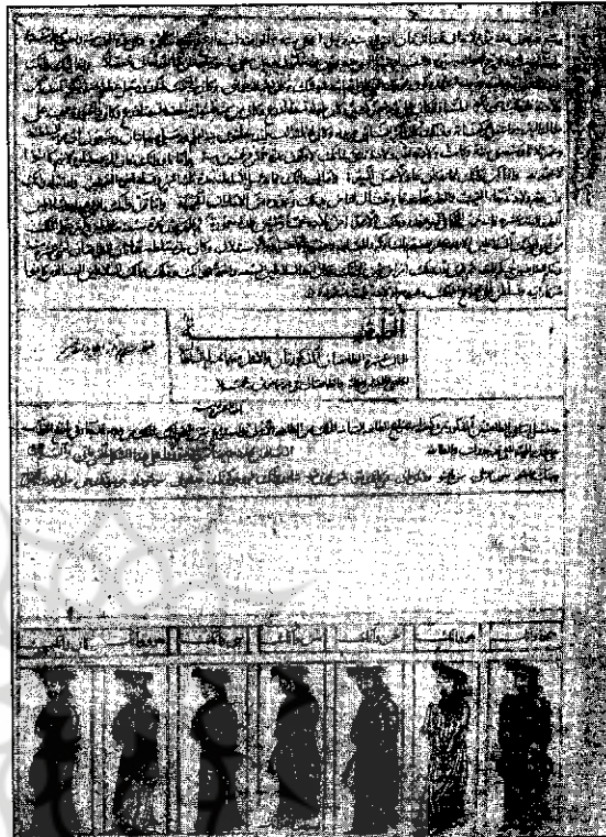
نمونه‌ای از دستنویس تحریر عربی جامع التواریخ، نسخه مجموعه ناصر خلیلی، از کتاب تاریخ چین

میان دوسرزمین ایران و چین از زمان‌های بسیار قدیم روابط تجاری و مدنی و علمی وجود داشته است. جاده ابریشم مهمترین راه بازرگانی ملت ایران و چین بود. اشارات و اطلاعات بسیاری از فرهنگ و تمدن چین در کتب داستانی و حماسی و شعری ما وجود دارد. ۱۰ از سوی دیگر وجود کتیبه‌های متعدد چاپی حاوی اشعار فارسی و نام‌های شاعران چینی فارسی‌سرا در مساجد و معابر چینی، از فعالیت‌های ادبی - فارسی چینی‌ها در قرون گذشته حکایت می‌کند. ۱۱ هادی العلوی پژوهشگر عرب‌زبانی که مجموعه مسجد «دونسه» پکن را بررسی کرده است، می‌گوید: زبان فارسی و آشنایی با این زبان در کلیه کتاب‌های خطی عربی سایه‌انداخته است. در کتاب‌های خطی عربی، اغلب توضیحات و تفسیرهای انتهایی کتاب به زبان فارسی است و علاوه بر آن متن بسیاری از کتاب‌های خطی عربی به سبک فارسی است. ۱۲