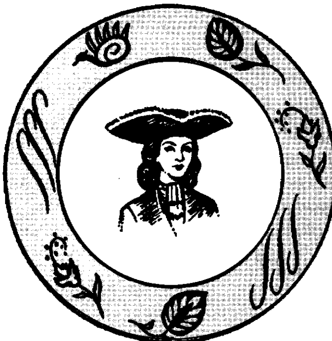
بشقابی یا تصویر برلاندیر که در ۱۷۰۸ در تبریز ساخته شده است

بخش دوم کتاب از زمان عزیمت از استانبول شروع و به دروازه‌های اصفهان ختم می‌شود. در این بخش نیز موضوعاتی چون سفری غم‌انگیز و پرهیجان، خداحافظ اسکودار، از شهری به شهر دیگر، ترس از مار، راه ارمنستان، کشتی نوح، بندر آرامش، ایروان شهری با محیط چهار هزارپایی، باریابی در حضور پنجه آفتاب، تولد عشقی جدید،