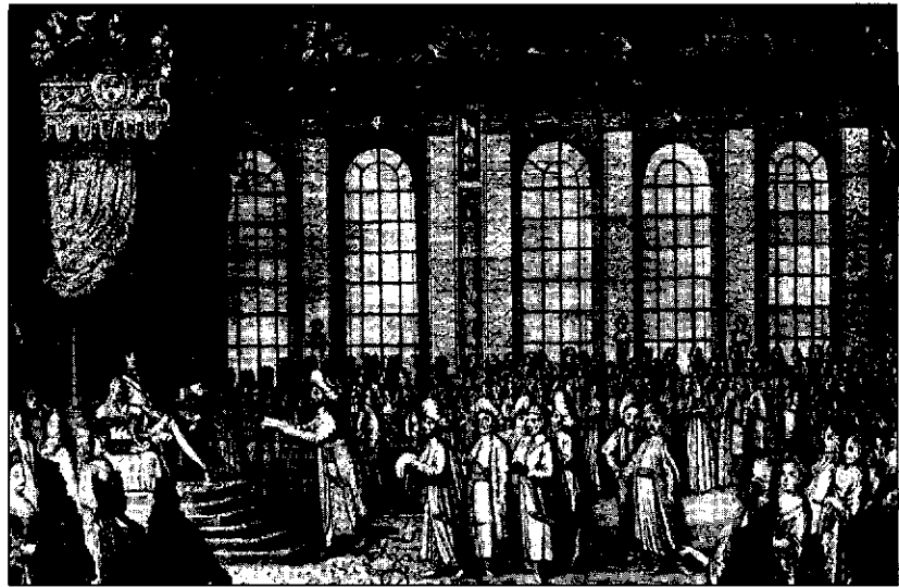
لویی ۱۴، سفیر ایران را به حضور می‌پذیرد