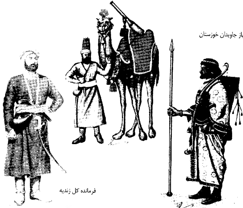
فرمانده کل زندیه

کتاب به فهم آسان مطالب دوره‌های تاریخی کمک شایانی می‌نماید بخصوص تجسم توضیحات تحولات نظامی با لحاظ این تصاویر آسان می‌گردد.