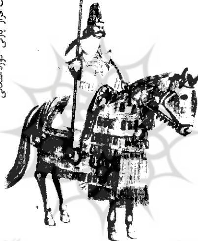
سوار سنگین جنگ افزار پارتی - دوره اشکانی

نهادهای نظامی اشکانیان و فنون نظامی آنان (تبحر در نیزه‌پرایی، تیراندازی و سوارکاری)، از دیگر موضوعات مورد بحث این گفتار است. از دیدگاه مؤلف، مؤلفه اصلی اندیشه نظامی اشکانیان، جنگ و گریز و اغفال دشمن و شورش مردمی می‌باشد. ۱ گفتار دوم این فصل به بررسی تاریخ نظامی و اندیشه نظامی در دوره ساسانی اختصاص یافته است. در این گفتار مؤلف تاریخ سیاسی و نظامی ساسانیان را به تفصیل تشریح نموده و نحوه به قدرت رسیدن آنان، اوضاع مقارن ظهور آنان (ساسانیان) و تشکیل سلسله و مخاصمات و درگیری‌های آنان با دول مجاور (اقوام بیابانگرد شمالی، رومیان و اعراب) را آورده است. اصول و مبانی اندیشه نظامی ساسانیان، همان اصول و مبانی دوران هخامنشی است با این تفاوت که ایجاد استحکامات نظامی و دفاعی که به تقلید از روم صورت گرفته بود و استفاده از ابزار و آلات قلعه کوبی در این دوره بر آنها اضافه گردیده است. وضعیت ارتش و تشکیلات نظامی و جایگاه