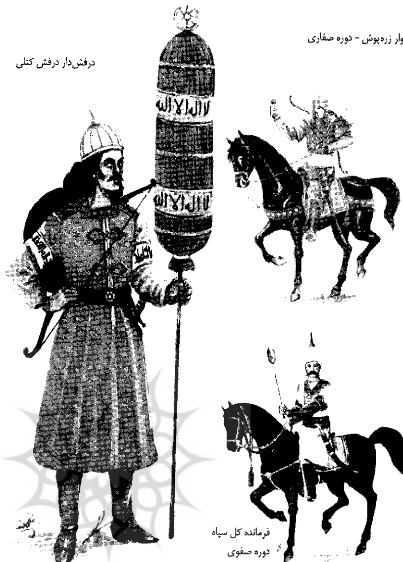
فرمانده کل سپاه دوره صفوی

مورد بحث می‌باشند. مبنای اندیشه نظامی در دوره قاجار: ۱- درباره گرای ۲. بیگانه‌گرایی ۳. وابستگی، مؤلف درباره دو اصل بیگانه‌گرایی و وابستگی در بررسی ارتش ایران در این دوره، به تفصیل بحث نموده است. اندیشه نظامی امیرکبیر که از دو اصل بنیچه ۳۳ و بدل ۳۴ تشکیل شده، در ادامه این فصل آورده شده است.