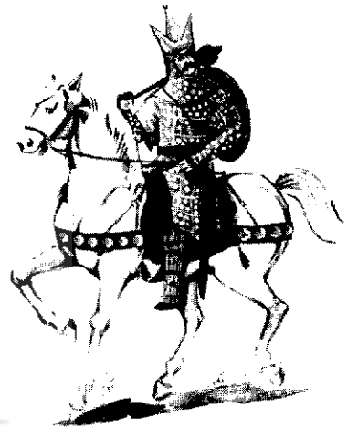
افسر سوار سنگین جنگ افزار - دوره ساسانی

با همسایگان را از دیگر مبانی نظامی این سلسله برمی‌شمارد. توصیف تمدن ماد و اثرات آن، مبحث بعدی اولین گفتار، از فصل ششم می‌باشد. گفتار دوم این فصل به بررسی قیام کوروش پرداخته و روند شکل‌گیری سلسله هخامنشیان را تشریح می‌نماید که شامل وضعیت قوم پارس قبل از برخاستن به مقابله با مادها، نبردهای این خاندان با مادها و بدست گرفتن قدرت می‌باشد. روابط کوروش با دول مجاور (بابل - لیدی و سکاها)، موضوع دیگر این گفتار است. اصلاحات داریوش و روابط داریوش با همسایگان و نیز دیگر پادشاهان هخامنشی با همسایگان و رخدادهای عمده آنان، به تفصیل در این گفتار آورده شده و به دنبال آن به وضعیت ارتش و جایگاه آن و نیز تشکیلات ارتش پرداخته شده است. مؤلفه‌های اندیشه نظامی در این دوره (هخامنشیان) از نظر مؤلف بدین‌گونه‌اند: ۱. سرعت عمل در میدان نبرد