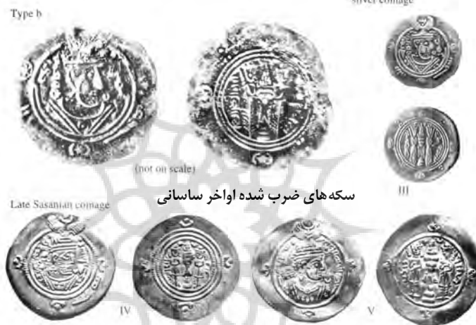
سکه های ضرب شده اواخر ساسانی