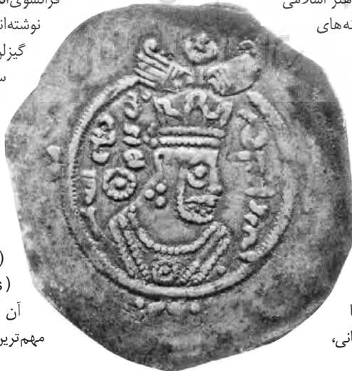
پشت سکه فرخزاد، ضرب اردشیر خوره (فارس)، با طرح چهره فرخزاد

در کتاب حاضر، حدود ۳۳۰ سکه برگزیده شده است. بخشی از این سکه ها براساس نمونه های اواخر ساسانی، عرب ساسانی، بیزانسی و سکه های ضرب شده نقره ای اموی هستند (فصل اول) و بخش دیگر، شامل سکه هایی است که ضرب جدیدتراند و پیش نمونه ضرب شده ندارند که تعداد آنها هم فراوان