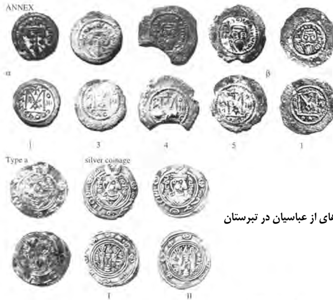
سکه های مسی اواخر ساسانی یا عرب ساسانی از شوش