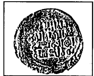
روی سکه سلطان سنجر سلجوقی ۵۱۱ - ۵۵۲ هجری

مؤلف در بخش مربوط به معرفی سکه های ایوبیان حلب در