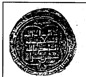
پشت سکه ابن کاکویه محمدبن دشمنویار ۳۹۸ - ۴۱۴ هجری