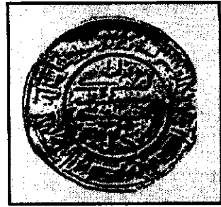
روی سکه نوح بن نصر سامانی ۳۳۱ - ۳۴۳ هجری