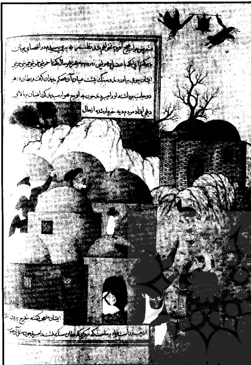
میناتور «لاک پشت و دو بطن» اثر صادقی بیک افشار، از نسخه انوار سهیلی، قزوین، حدود ۱۰۰۲ ه.ق.

خلعید از صادقی بیک افشار، علاوه بر سلوک ناخوشایند و درشت‌خویی و بدسری وی، اتهام سوءاستفاده از کتابخانه و فروختن یکی از آثار موجود دوره تیمور به میان کشیده می‌شود. این ماجرا را جهانگیر، شاه گورکانی، در تزوک جهانگیری، به خوبی وصف می‌کند و آن اینکه در کتابخانه سلطنتی نگاره‌ای عالی از جنگ تیمور با تقتمیش خان - امیرالتین اردو - وجود دارد با دو بستان و چهل و یک صورت و مصور آنهم میر خلیل‌الله نقاش نام‌آور دربار شاهرخ است و این نگاره از زمان شاه اسماعیل و شاه طهماسب به دست شاه عباس می‌رسد. صادقی بیک کتابدار آنرا از کتابخانه خارج می‌کند و به شخصی می‌فروشد. از اتفاق این اثر بدست خان عالم سفیر جهانگیر در اصفهان می‌افتد و خان عالم ماجرا را به شاه عباس تعریف می‌کند و شاه عباس با اینکه از صادقی بیک بازخواست نمی‌کند ولی از مقام و مکانت او می‌کاهد و از قرار معلوم او را از ریاست کتابخانه برکنار می‌کند ۴۷ و اینکه این برکناری «جبراً و قهرآ» صورت می‌گیرد، شاید اشاره‌ای به این ماجرا باشد.