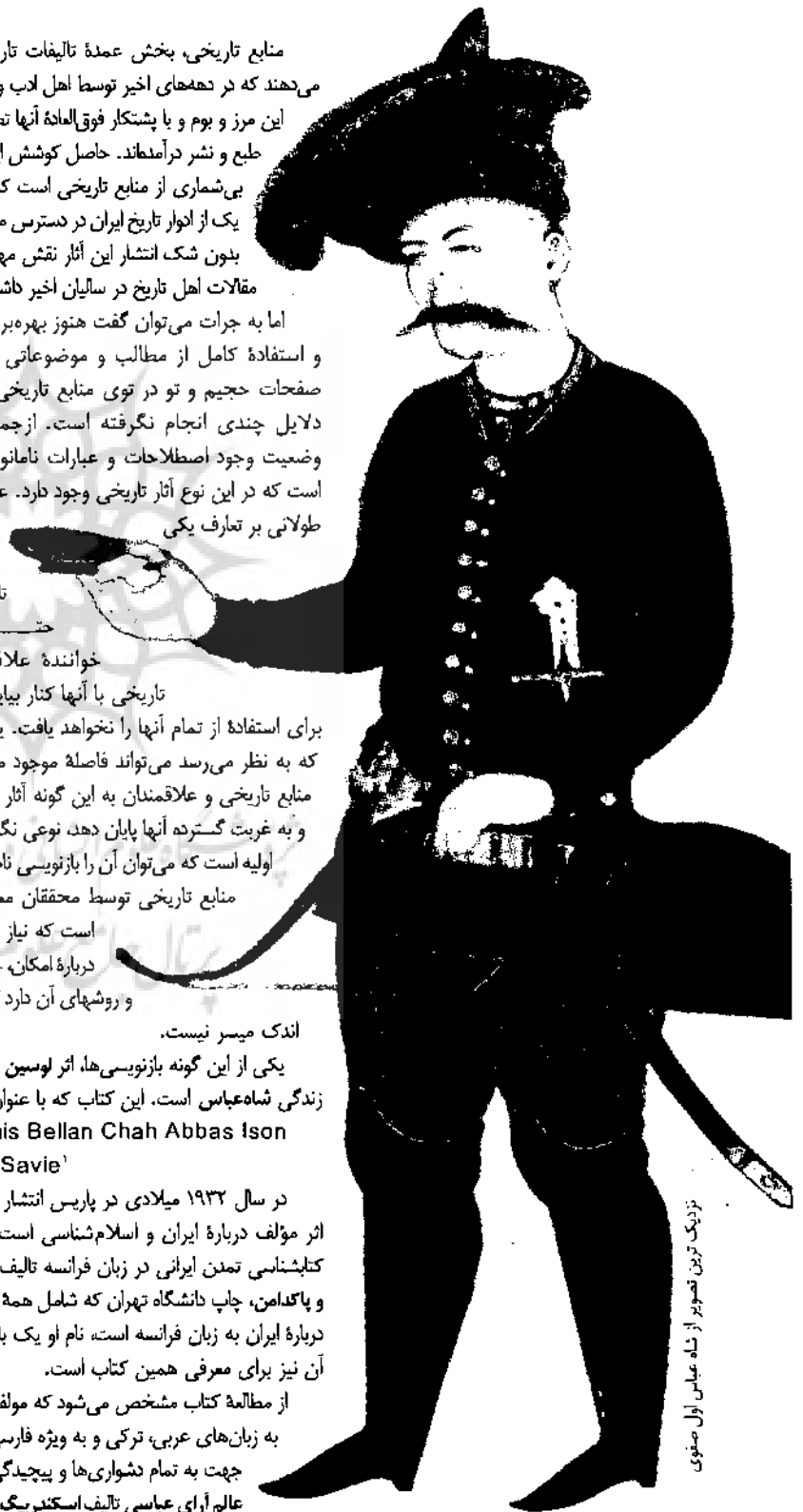
زندگی ترین تصویر از شاه عباس اول صفوی

«پیشگفتار مؤلف» مقدمه‌ایست پیرامون شناخت منشاء و پیدایش دولت صفویان و مسائلی و موضوعاتی که شاه اسماعیل در آغاز با آن مواجه بود.