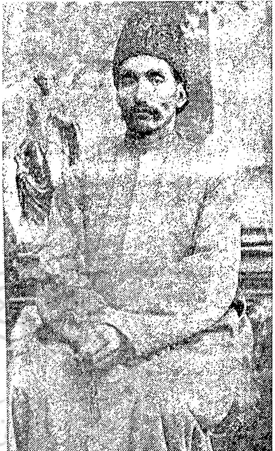
معرفی اثر در دست انتشار

برخورد عصر فتحعلی‌شاه و محمدرضا قاجار با اروپا باعث ایجاد شیوه جدید تاریخ نگاری در ایران گشت. این شیوه ابتدای امر، خود را در تاریخ شهرها متجلی نمود و سپس در دوران مشروطه و پس از آن به بیان نو و جدیدی در تاریخ ایران متحول گشت.