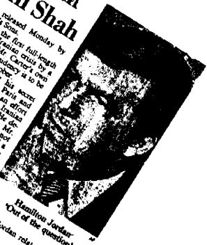
Hamilton Jordan, former aide to President Carter, is shown in a photograph. He is wearing a suit and tie, and has a serious expression. The photo is in black and white.