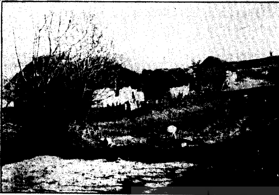
* روستای "کلا" یکی از روستاهای محروم مناطق کوهستانی استان مازندران

* از مهمترین عوامل تقلیل سطح زیر کشت گندم در این استان، سیاستهای غلط قیمت گذاری روی این محصول و همچنین تبدیل اراضی خشک گندم کاری به باغات و تأسیسات کارگاهی، اختلاط در بندر گندم با سایر بذرهای علفهای هرز و عدم تامین کافی کودشیمیائی می باشد.