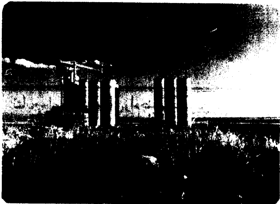
مای شمالی سیلوی یکصد و بیست هزار تنی تبریز قبل از بتن ریزی و تکمیل کندهای بتنی میانی