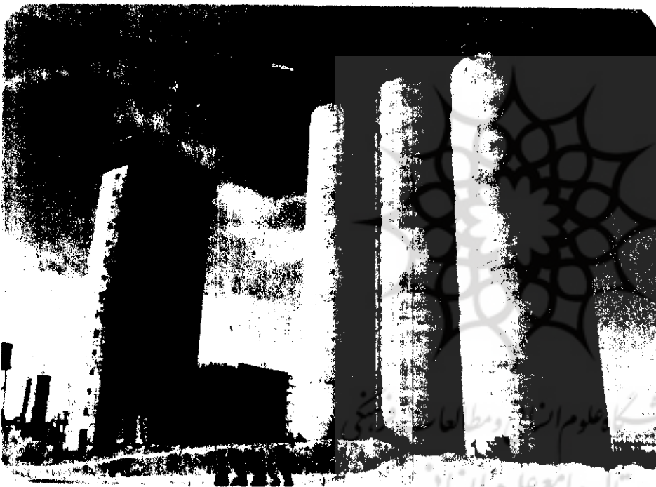
نمای سیلوی ۸۰ هزار تنی قزوین وضعیت در شش ماه پس از راه اندازی کارگاه

تشکیلات مجری طرح سیلو در آینده نقش موثری در برنامه های آتی کمیته عمران جهاد در زمینه سد و کانال ایفا خواهد کرد.