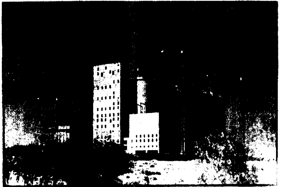
نمای جنوبی سیلوی یکصد و بیست هزار تنی تبریز بعد از احداث سری ۹ تانی کندهای میانی

جهاد با قبول خطر کردن اجرای این طرح اسطوره اجرای یک چنین طرحهایی را که فقط بدست پیمانکاران خارجی انجام میگرفت شکست.