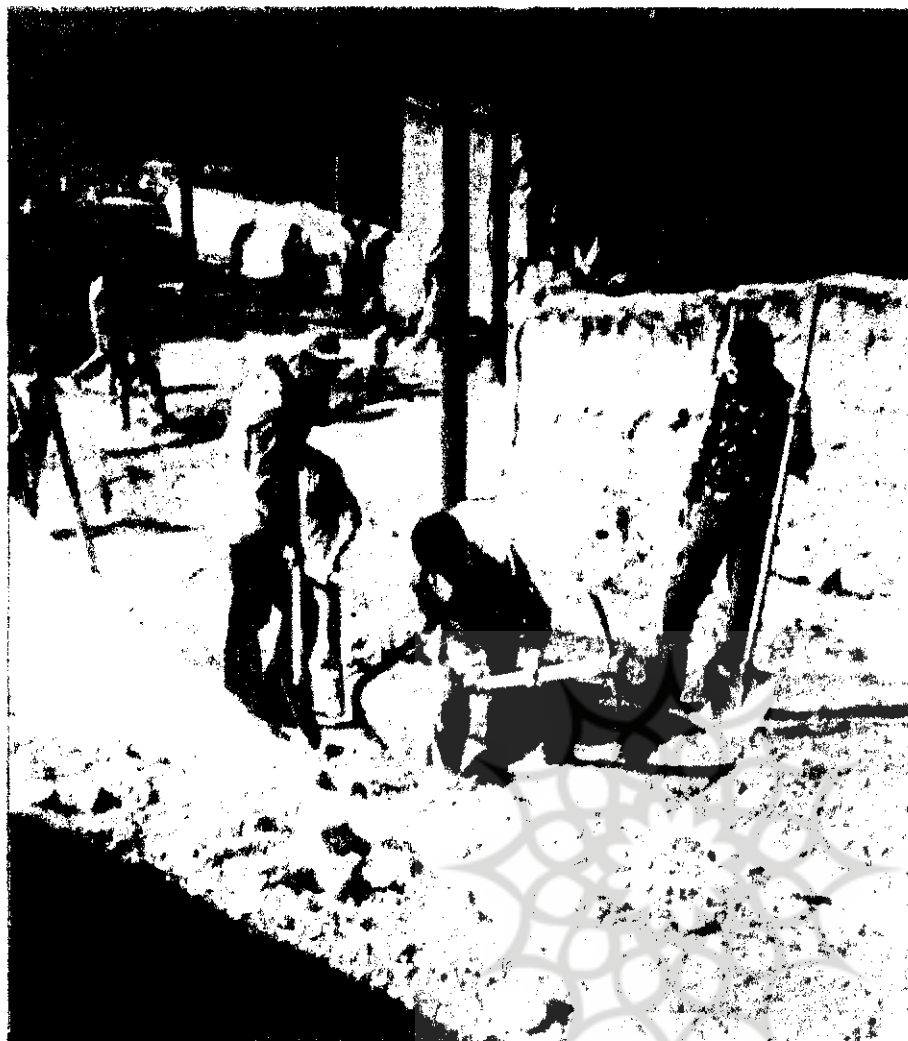
برادران دانش آموز در حال حفر کانال آب

که موجب رشد و شکوفایی خلاقیتهاست و ضمناً از هرز رفتن نیروهای جوان و کسانیده شدن آنها به بدام گروهکها و انحرافات دیگر نیز جلوگیری می شود که این مساله خود نقش مؤثری در ساختن اجتماع و سالم سازی جامعه دارد و تا حدود زیادی می تواند مشکلات شهرها و روستاها را مرتفع کند. مساله سوم اینکه بیشتر اعضای جهاد را دانشجویان دانشگاهها تشکیل میدهند که پس از باز شدن دانشگاهها به سرکلاسهایشان بر می گردند و نتیجتاً در پیشبرد کار جهاد وقفه ایجاد خواهد شد، در صورتیکه اگر همین دبلمه ها و دانش آموزان آموزش ببینند و در کنار برادران جهاد مشغول بکار شوند به مرور می توانند با نحوه کارهای جهاد و مشکلات آن آشنایی پیدا کنند و خلاصه ایجاد شده در رابطه با باز شدن دانشگاهها را پر کنند.