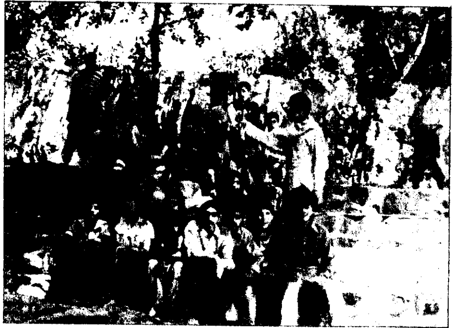
تجمع برادران دانش آموز زانلی و ایلامی در محل اردوگاه

آرمانهای متعالی فعالیت کنند، از این رو با توجه به گستردگی کارش، این واحد از «اردوهای دانش آموزی» به «جهاد مدارس» تغییر نام یافت. تا حین استفاده صحیح دانش آموزان از تعطیلات تابستانی بتوانند گرفتارها و مشکلات پیشماری را که به علت کمبود نیرو و امکانات، پس از انقلاب اسلامی پیش آمده بود و مانع از انجام و اجرای طرحهای صحیح در مملکت میشد، با حداقل امکانات و رادمان بیشتری رفع نمایند تجربه‌ای نیز برای آینده جامعه کسب کنند.