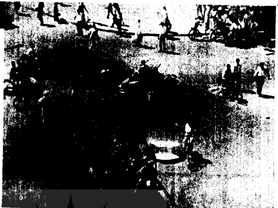
قوای نظامی مستقر در شهر خرطوم

از سال ۱۹۷۶ تولید هر جریب پنبه که مهمترین منبع درآمد سودان و ۷۵٪ از صادرات