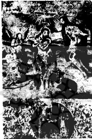
از نقاشی‌های صحن کلیسای وانک

۱۳ - نمازخانه سورب استپانوس . این نمازخانه از نظر وسعت بزرگترین نمازخانه و بهمین جهت مراسم مذهبی دستجمعی در این نمازخانه برگزار میشود . محل آن در محله یعقوبجان و بنای آن سال ۱۷۱۴ انجام یافته است . همچنانکه گفتند در جلفای اصفهان نمازخانههای دیگری نیز بوده است که که بمرور زمان ویران شده و امروز اثری از آنها باقی نیست اینها عبارتند از :