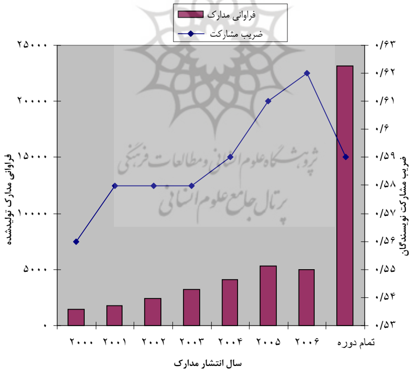
نمودار ۱. ضریب مشارکت نویسندگان ایران در نمایه استنادی علوم در سالهای ۲۰۰۶-۲۰۰۰

بالاترین ضریب مشارکت ۰/۶۲ و مربوط به سال ۲۰۰۶ بوده است و بیشترین مشارکت در این سال در تولید مدارک ۳ نویسنده‌ای با تولید ۱۳۶۷ مدرک (۲۷/۵۲٪) و سپس مدارک ۲ نویسنده‌ای با تولید ۱۳۰۷ مدرک (۲۶/۳۱٪) بوده است. ضریب مشارکت هم‌نویسندگی در میان نویسندگان ایران، در این پژوهش از شیب صعودی برخوردار بوده است و این امر نشان‌دهنده علاقمندی و استقبال نویسندگان ایران به تولید آثار علمی مشارکتی است (جدول ۲). نمودار شماره ۱، روند رشد ضریب مشارکت را در مقایسه با تعداد مدارک به تفکیک سالهای مورد مطالعه با وضوح بیشتری به نمایش گذاشته است.