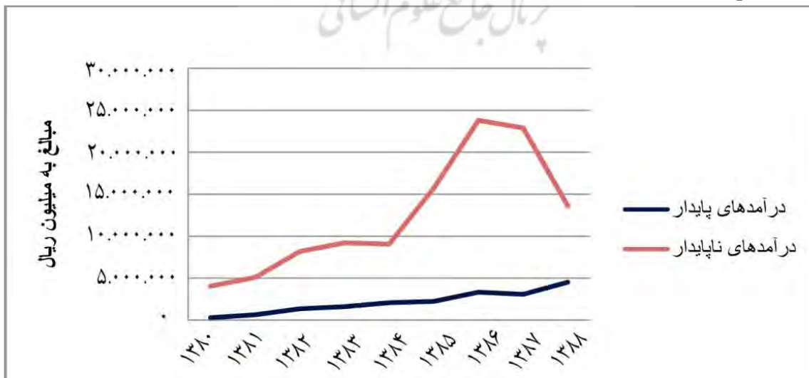
نمودار ۲- مبالغ درآمدهای پایدار و ناپایدار شهرداری تهران طی سال‌های ۱۳۸۰-۱۳۸۸