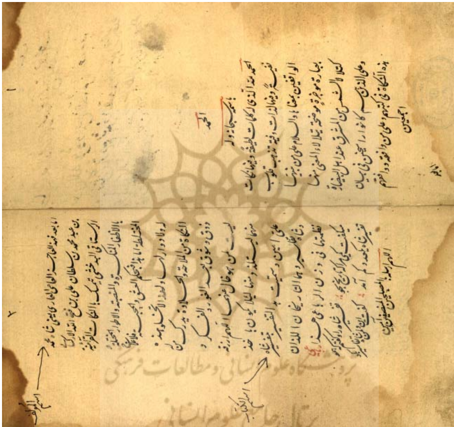
پیام بهارستان / ۲۵، ۳، ش ۱۱ / بهار ۱۳۹۰

ش ۲۰۸۷۳ تفسیر شاه = شاه تفاسیر، تألیف ملا شاه بدخشی