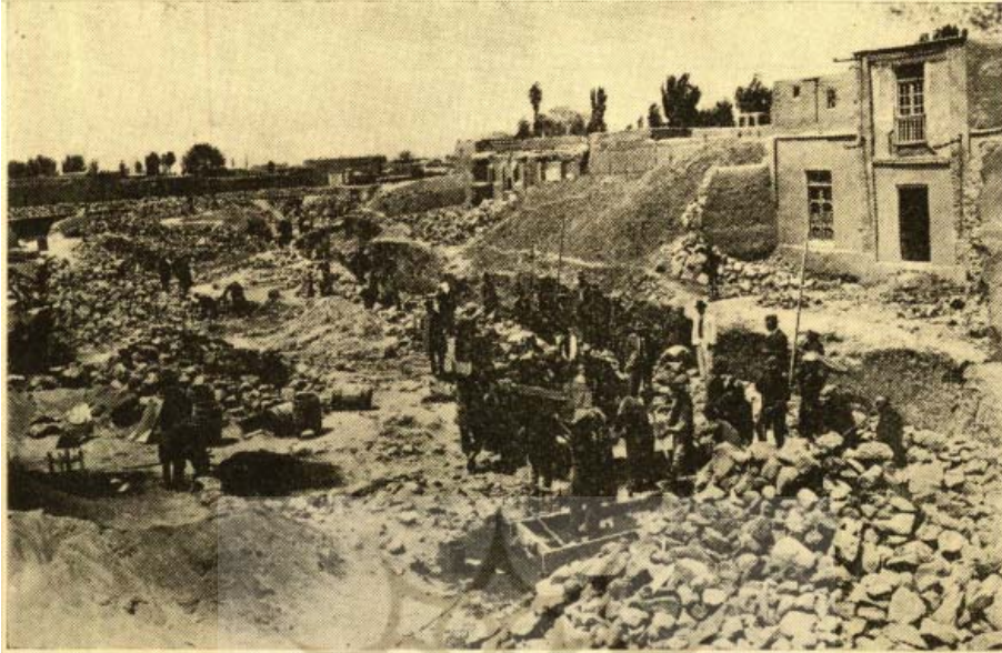
عکس فوق منظره از خرابی خانه ها و توسعه مهرانرود میباشد