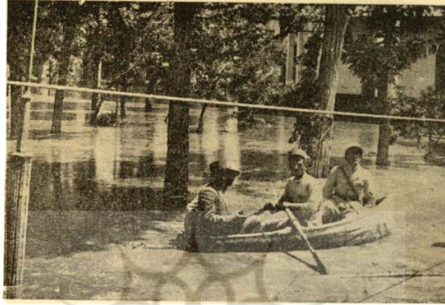
عکس فوق حیاط عالی قاپو را نشان میدهد که از کثرت آب عبور و مرور بوسیله قایق انجام میگردد