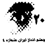
چشم‌انداز ایران شماره ۴

هر کس سلوکی ولو کوتاه در سیر فلسفه از آغاز تاکنون بکند، به وضوح حرکت دایمی متفکران را از قطب افراط به قطب تفریط مشاهده می‌کند. آخرین حلقه از این حلقه‌ها مدرنیته است. کلمه مدرنیته که گویا مدرن‌ترین اصطلاح از گروه کلماتی است که از ریشه MODERNUS لاتینی ساخته شده‌اند، ظاهراً نخستین بار در قرن ۱۹ به کار رفته است، اما ریشه این کلمه ۱۵ قرن سابقه استعمال دارد و فقط در قرن ۱۹ و ۲۰ است که این کلمه شامل مفاهیم متعددی نظیر مفاهیم فلسفی، هنری، علمی، تاریخی و اخلاقی می‌شود. وجه جامع همه این مفاهیم عبارت است از زلزله‌ای که در ارکان وجود و تفکر انسان در اواخر قرون وسطی اتفاق افتاد. زلزله‌ای که مدار حرکت انسان و جهان را عوض کرد. انسان و جهان (تا آن جا که متأثر از افکار انسان است) در روزگار ما، نتیجه مدار "مدرن" پس از قرون وسطی است. این مدار نو در آن زمان‌ها "مدرن" نامیده می‌شود و امروزه ما آن را رنسانس می‌خوانیم. رنسانس حادثه‌ای است که ایتالیا در تحقق آن نقشی تعیین‌کننده دارد و با این که تعداد بسیار زیادی کتاب و مقاله در توضیح و تشریح آن حادثه عظیم نوشته‌اند، اما همچنان این نیاز وجود دارد که فیلسوفان و مورخان و دانشمندان در این باره فکر کنند و سخن بگویند.