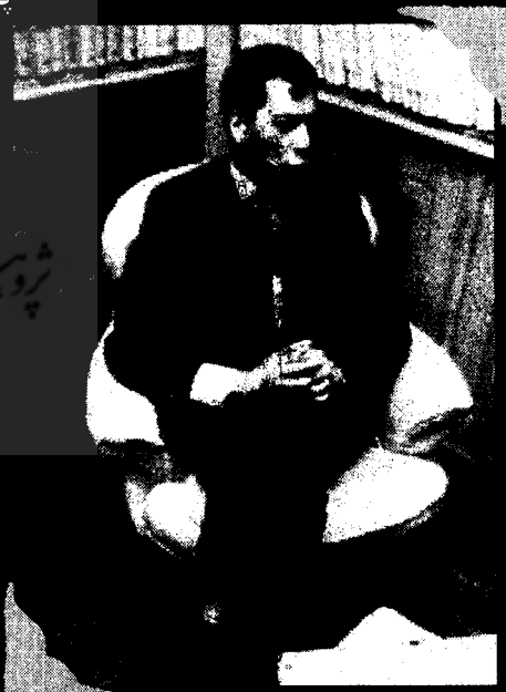
ماریو بارکاس یوسا در بونوس آیرس، به عنوان یکی از داوران جایزه رمان مجله‌ی پریمرا بلانا، ۱۹۶۶.

در یک سینما در مکزیک، بارکاس یوسا مشت‌های بر دوست آن زمان خود کابریل کارسیا مارکز می‌کوبد. دلایل آن هرگز روشن نشدند اما همه چیز نشان می‌دهد که دلیل شخصی بوده و تمایلات سیاسی‌شان تنها فاصله آن دورا تشدید کرده. این نقاشی مربوط به زمان آن رسوایی است.