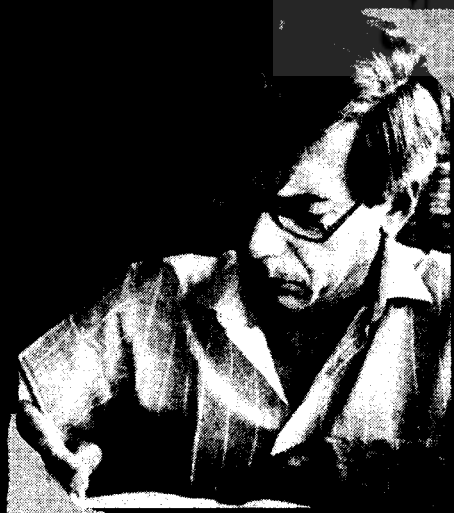
یوسا در حال نوشتن مقاله