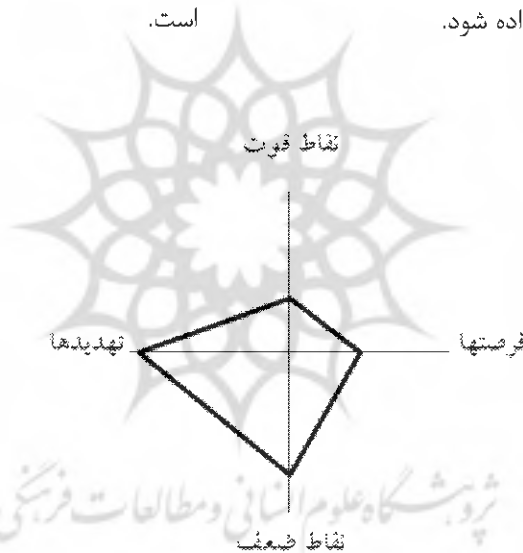
شکل ۱- تبیین وضعیت نواحی استقرارپذیری استراتژیک طرح تجهیز و نوسازی اراضی شالیزاری در مدل SWOT

با توجه به شکل (۱) می‌توان گفت که بیشترین وضعیت استقرارپذیری استراتژیک طرح تجهیز و نوسازی اراضی شالیزاری در استان گیلان در ناحیه WT یعنی استراتژی عقب‌نشینی یا کاهش قرار داشته که براساس آن باید از سطح فعالیت‌ها در طرح تجهیز و نوسازی اراضی شالیزاری کاسته شود تا طرح به صورت اصولی دنبال شود پس از آن استقرارپذیری در ناحیه WO یعنی استراتژی تغییرجهت قرار دارد که با توجه به عملکرد ضعیف ارائه شده و همچنین فرصت‌های موجود می‌بایست تغییر جهت فعالیتی داده شود.