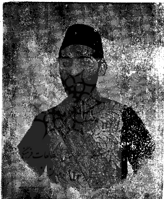
حاجی حبیب‌الله خان معتمد الوزاره ( صدر السلطنه )

پسر ساعدالدوله سردار تنکابنی عقد میشود بمبار کی این کتاب از شخصی ایتباع شد. این تاریخی است که عم بزرگوارم میرزا فضل الله وزیر نظام انشاء فرموده، هشتادسال عمر کرد بعد از پدرم بقاصله دوازده سال مرحوم شد و بعد از بر هم خوردن دستگاه صدارت هر قدر کوشش کرد با کمال استعداد و قابلیت صاحب کار نشد و از پدرم بزرگتر بود و بنده زمان عزل پدر ده ساله بودم و زمان فوت پدر هفده ساله،