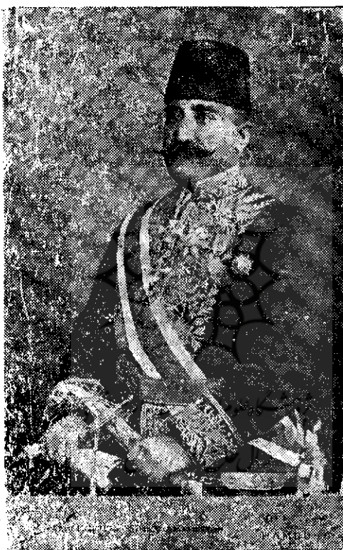
اوانس خان مساعدالطنه

در آن شهر بهمین سمت یا بسمت معاونت سفارت میزیسته بعد بایران آمده و چندی ریاست دفتر مرحوم ابوالقاسم خان قراگزلو نایب السلطنه را در طهران عهده دار بوده و در ۱۹۱۲ (۱۳۳۰ هجری) بمقام سفارت ایران در برلین انتخاب شده ، پس از آن بهمین مقام بلندن رفته و در آخر کار سفیر ایران در توکیو بوده است . در اواسط