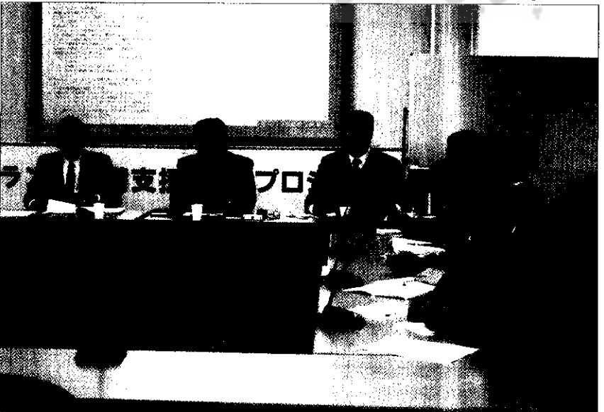
هیئت ایرانی در کنار میزبانان خود از قوه قضاییه ژاپن