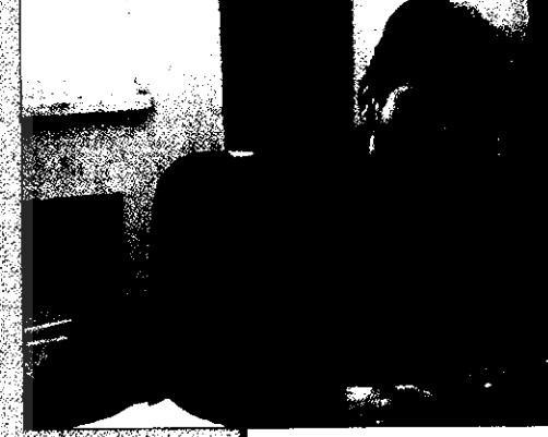
رفاه از فواید