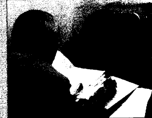
در بنده استادت چو اوستی