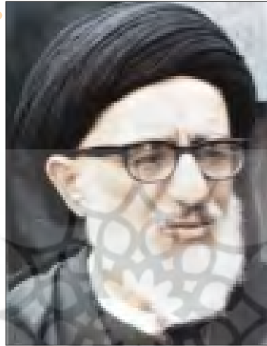
را شهید کردند».

«پسر سعیدی می گوید با آمبول پدرم را کشتند و علتش این بود که پدرم در باره سرمایه گذاری در ایران توسط راکفلر و طرفدارانش اعلامیه داده بود». پسر سعیدی گفته بود: «افتخار می کنم که پدرم