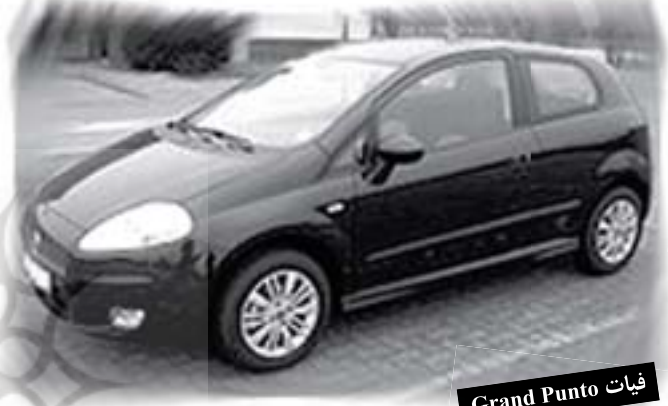
فیات Grand Punto

در ۱۹۸۶، فیات موفق به خریداری "آلفا رومئو" از دولت ایتالیا شد. فیات ۵۰۰ جایزه ی اتومبیل سال اروپا، نشان برتر خودروسازی، دوازده بار ظرف ۴۰ سال گذشته به گروه فیات تعلق گرفت که بیش از هر خودروساز دیگری بوده است. اخیراً نیز "فیات نوا" ۱۵۰۰ جایزه ی اتومبیل سال ۲۰۰۸ اروپا را از آن خود گردانیده است.