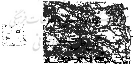
شکل ۱ موقعیت دشت مورد مطالعه

در دشت نیشابور نیز مسأله بحران آب، در نتیجه به هم خوردن تعادل هیدرولوژیکی و افزایش تقاضا از منابع آبی از سال ۱۳۶۵ به بعد نمود پیدا کرده است و چنانچه بهره‌برداری به صورت بی‌رویه از منابع آب و الگوی بیلان منفی از منابع موجود، متوقف نشود به تدریج حجم آب شیرین و قابل استفاده کاهش خواهد یافت و مسئله بحران آب، منجر به تهی شدن کامل مخازن آب زیرزمینی دشت شده، تمام سرمایه‌گذاریهای انجام شده از بین خواهد رفت. دشت نیشابور، جزئی از حوضه آبریز کال‌شور نیشابور است که در شمال شرق کویر مرکزی واقع شده است. شکل ۱ نشان‌دهنده موقعیت منطقه مورد مطالعه است.