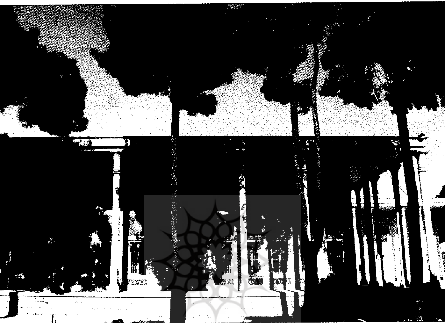
نمای ساختمان کارگاههای هنرستان هنرهای زیبای اصفهان

پرندهکان با حاشیه‌های متعدد مشاهده می‌شود. نماهای فرعی این بخش (فرم ۱) در ضلع غربی، شمالی و شرقی دارای تزیینات آجر و پنجره‌هایی با تقسیمات ساده هندسی با کشش عمودی از جنس چوب و شیشه است.