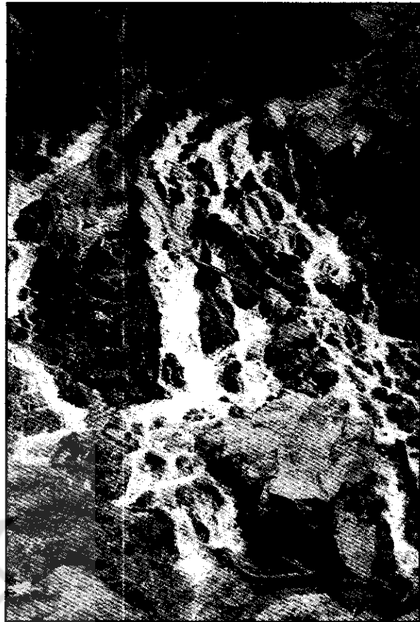
چشمه معجز در داخل دهانه غار

در آب‌ملخ، بیش از هر چیز از وجود فقر و محرومیت و مشکلات، در کنار نمایشگاهی عظیم از نعمات و موهبت‌های الهی حیرت‌زده می‌شویم. گستردگی فضای جذاب و زیبای طبیعی موجب شده ظرفیت این مرکز برای گردشگر در حد و اندازه‌ای بالا باشد. آب‌ملخ و تخت سلیمان علی‌رغم همه کمبودها و شرایطی که فقط گردشگران مرد جوان را جذب می‌کند، در سالهای اخیر مرتباً مسافران بیشتری را پذیرا بوده است.