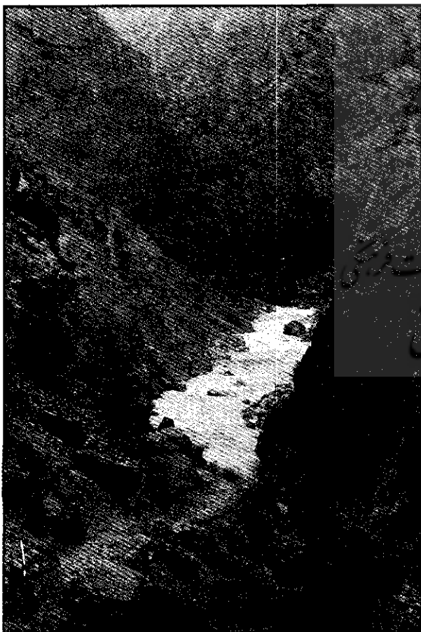
نمایی از مناظر محدوده آب‌ملخ

روستای آب‌ملخ در طول جغرافیایی ۲۲° و ۵۱° در عرض ۹° و ۳۱° قرار گرفته است. گردشگاه آب‌ملخ و