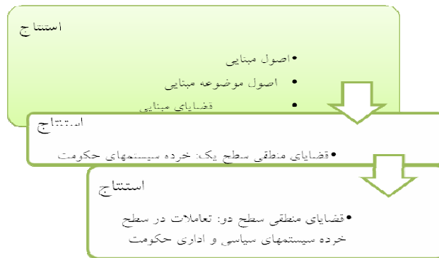
شکل ۳: مراحل استنتاج منطقی قضایا

نکته بسیار مهم و قابل تأمل آن است که در همه عرصه‌ها و خرده‌سیستم‌های حکومتی بر ضرورت کنترل متقابل و در عین حال، وحدت و هم‌نوایی خرده‌سیستم‌های اداری و سیاسی تأکید می‌شود. در این شأن این خرده‌سیستم‌ها جدا نیستند، هر چند مستقل از یکدیگرند، موظف به کنترل یکدیگر در جهت نیل به اهداف اصیل جامعه‌اند.