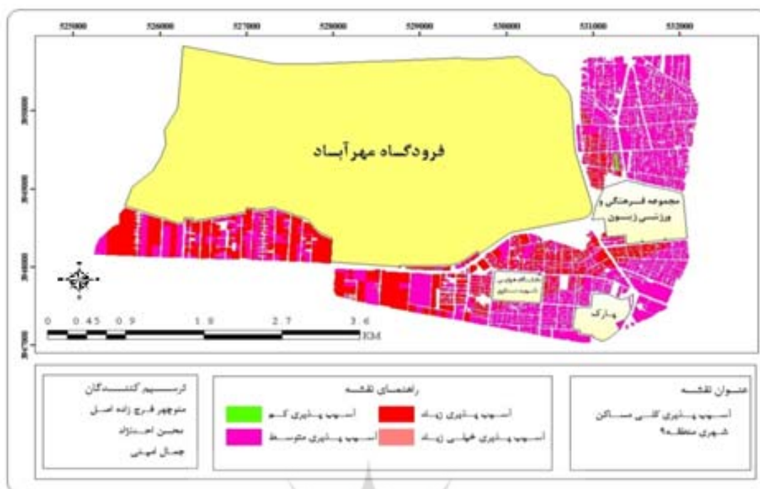
شکل ۳- آسیب‌پذیری کلی مسکن شهری منطقه ۹

ناحیه ۲، ۵۱/۰۲ درصد ساختمانها در درجات آسیب بین صفر و یک قرار می‌گیرند که در منطقه ۹۹/۹۱ درصد مسکن منطقه را شامل می‌شود و ۰/۰۹ درصد از مسکن منطقه نیز در درجات آسیب بین یک تا دو واقع می‌شوند. در سناریوی ۸ مرکالی نیز در ناحیه ۱، ۴۳/۸۹ درصد و در ناحیه ۲، ۳۵/۴۱ درصد ساختمانها در درجات آسیب بین صفر و یک قرار می‌گیرند، که در منطقه ۷۹/۳ درصد مسکن منطقه را شامل می‌شود و نیز ۵/۰۳ درصد از مسکن ناحیه ۱ و ۱۵/۶۲۶ درصد از مسکن ناحیه ۲، که در کل منطقه ۲۰/۶۵۶ درصد ساختمانها خواهد شد، در درجات آسیب بین یک تا دو واقع می‌شوند، همچنین ۰/۰۳۴ درصد ساختمانهای منطقه نیز در درجات آسیب بیشتر از ۲ قرار می‌گیرند.