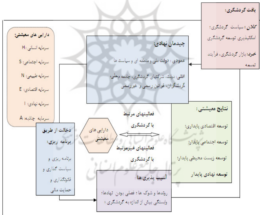
شکل ۲. چارچوب معیشت پایدار گردشگری

غیرمستقیم بر معیشت افراد داشته باشد. ساختار و چیدمان نهادی را می‌توان به دو بخش تقسیم کرد: ساختار نهادی عمودی و ساختار نهادی افقی. ساختار نهادی عمودی، ساختارها و نهادهای دولتی را در سطح ملی، منطقه‌ای، محلی و سیاست‌ها و قوانین آنها را در سطح کلان در برمی‌گیرد. در واقع، چیدمان نهادی عمودی معمولاً صنعت گردشگری را در سطح کلان تحت تأثیر قرار می‌دهد. در حالی که چیدمان نهادی افقی، در سطح محلی قرار دارد و تأثیرات مستقیمی بر معیشت مردم محلی در سطح مقصد دارد. این ساختارهای نهادی افقی و عمودی، از طریق مجموعه فرایندهای برنامه‌ریزی (سیاست‌گذاری، قانون‌گذاری، برنامه‌ریزی و حمایت مالی) در چگونگی وضعیت گردشگری و نقش آن در توسعه روستا دخالت می‌کنند.