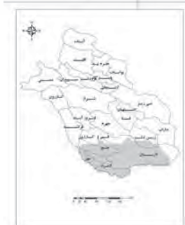
نقشه ۶. پهنه بسیار گرم و کم بارش

پهنه جنوبی استان در فصل بهار شرایط آب و هوایی بسیار گرم و کم بارش دارد. در این ناحیه میانگین دما ۲۳/۳ درجه سانتی‌گراد، میزان بارندگی ۳۱ میلی‌متر و میزان رطوبت نسبی ۳۵ درصد است. میزان نوسان دما در این فصل از ۳ تا ۳۶ درجه سانتی‌گراد در شبانه‌روز متغیر است (جدول ۵). محدوده تحت پوشش این پهنه اقلیمی در حدود ۱۷ درصد است. لارستان، لامرد، خنج و مهر دارای شرایط اقلیمی این پهنه هستند (نقشه ۶).