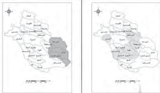
نقشه ۴. پهنه معتدل و نیمه بارشی

بخش مرکزی استان فارس در فصل بهار شرایط اقلیمی معتدل و نیمه بارش‌مند دارد. درصد رطوبت نسبی آن نسبت به سایر نواحی بیشتر است. این ناحیه قلمرو حاکمیت خود را بر چهارم، قیر و کارزین، فراشبند، کازرون، فسا، استهبان، ارسنجان و قسمتی از پاسارگاد و شیراز قرار داده است (نقشه ۴). در این ناحیه، میانگین دمای سالانه ۱۷/۸ درجه سانتی‌گراد، میزان بارش بهاره آن به مقدار ۴۵ میلی‌متر و میزان رطوبت نسبی سالانه ۳۶/۵ درصد است. درجه حرارت آن طی سال از ۰/۵ درجه سانتی‌گراد تا ۳۲ درجه سانتی‌گراد در نوسان است (جدول ۵). این قلمرو ۲۶ درصد از مساحت استان را می‌پوشاند.