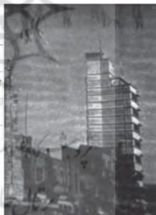
نخستین ساختمان بلند مرتبه تهران