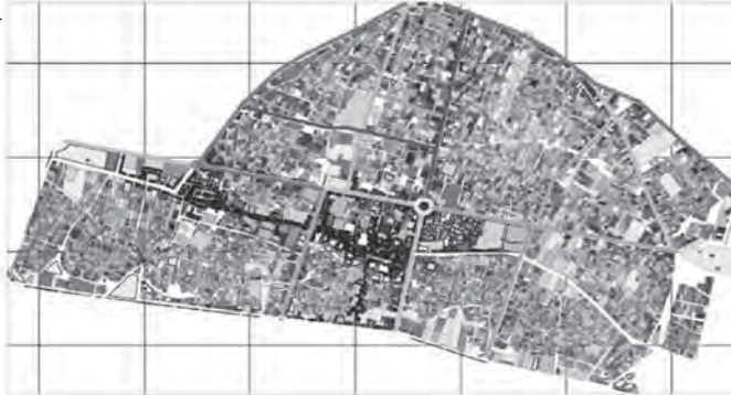
نقشه حجم ترافیک و رابطه آن با تراکم ساختمانی در بافت قدیم شهر زنجان