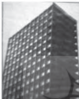
مجموعه بهجت آباد